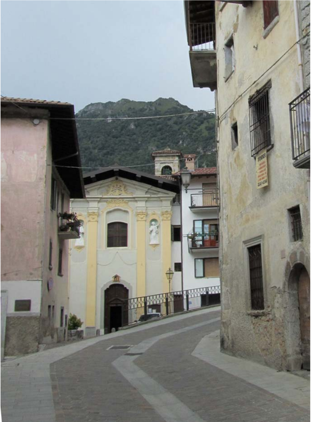
Elle est plus ou moins au bout de la ruelle « historique » par laquelle ne devraient en aucun passer les voitures dont les pneus font un bruit infernal sur les pavés.